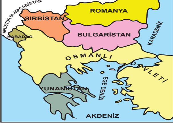
I. Balkan Savaşı Öncesinde Balkanlar

İTA.8.1.1. Avrupa'daki gelişmelerin yansımaları bağlamında Osmanlı Devleti'nin yirminci yüzyılın başlarındaki siyasi ve sosyal durumunu kavrar.