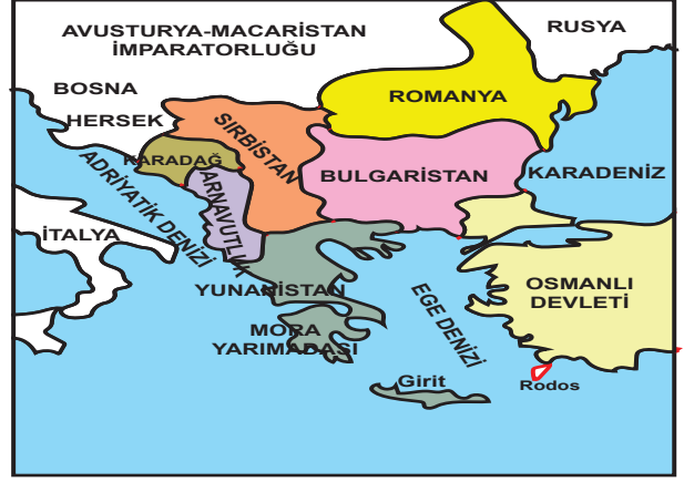
II. Balkan Savaşı Sonrasında Balkanlar

Osmanlı İmparatorluğu sınırları içinde bulunan hangi devlet, Birinci Balkan Savaşı sonunda bağımsızlığını kazanmıştır?